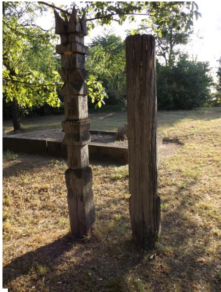
1. Csillagos-tulipános fejfa

szúrják, ilyenkor lényegesen kisebb lesz. Újabban megint divattá vált a kopjafa-állítás: előfordul, hogy sírkővel együtt találkozhatunk ilyenekkel temetőnkben is.